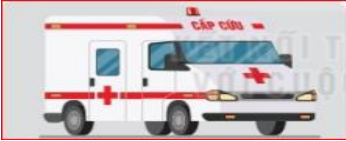
xe cứu thương