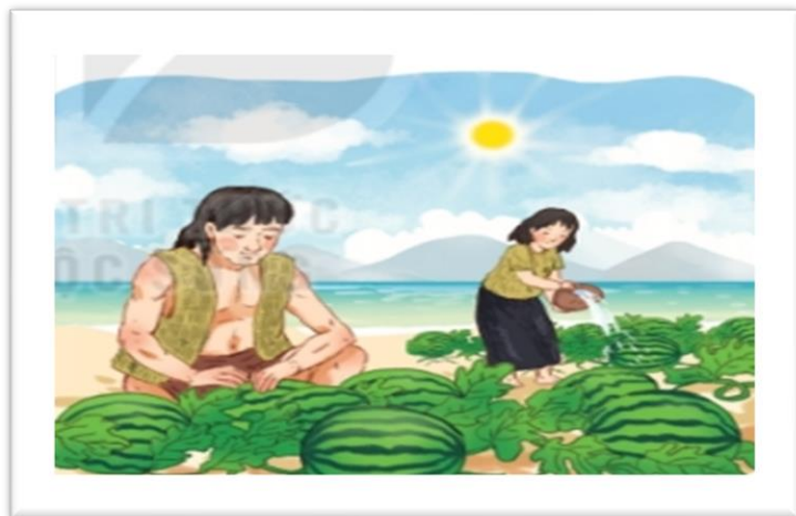
Mai An Tiêm

2. Viết vào vở tên của 2 nhân vật được nói đến trong chủ điểm Con người Việt Nam.