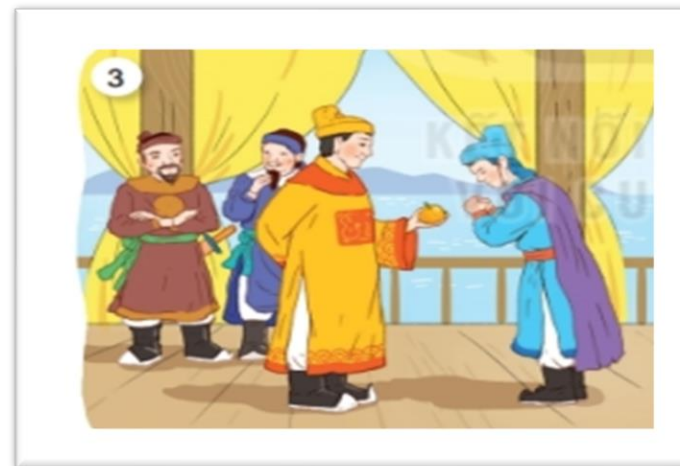
Trần Quốc Toản

Khi viết hoa tên người em cần lưu ý điều gì?